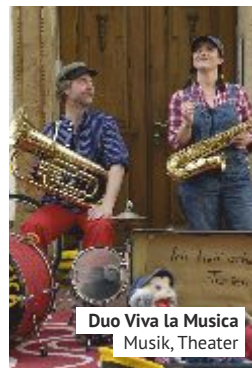
Duo Viva la Musica Musik, Theater