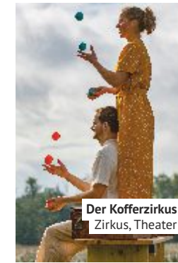
Der Kofferzirkus Zirkus, Theater