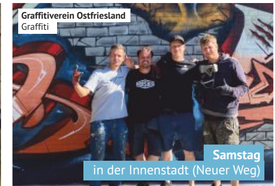
Graffitiverein Ostfriesland Graffiti